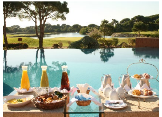
God mat och dryck

Quinta da Marinha ligger 35 minuters bilresa från Lissabon och bara 4 km from Guincho Beach. Gratis shuttlebuss till Cascais ingår för hotellets gäster. Från Cascais går pendeltåg in till centrala Lissabon.