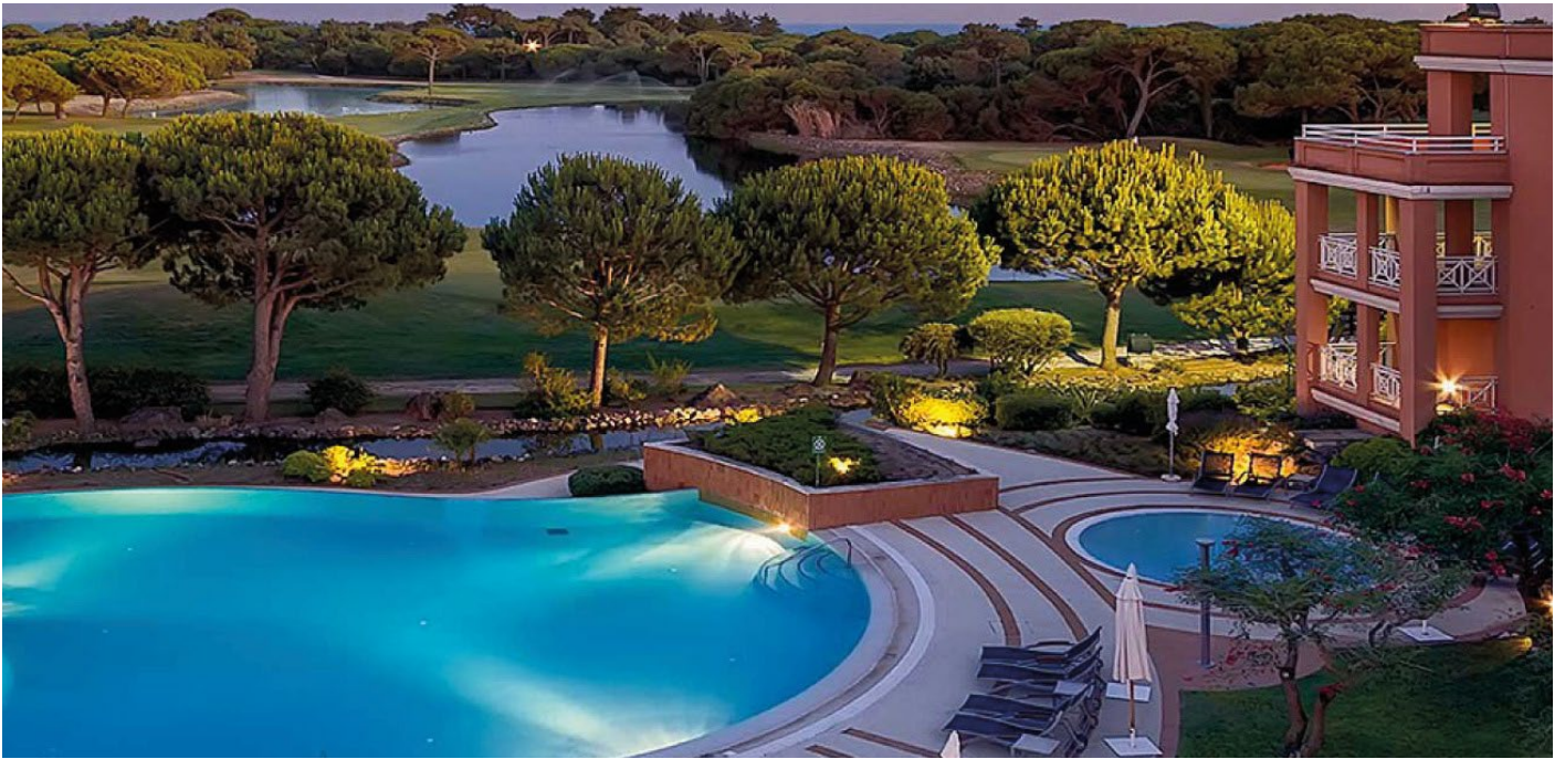
Poolområdet på Quinta da Marinha